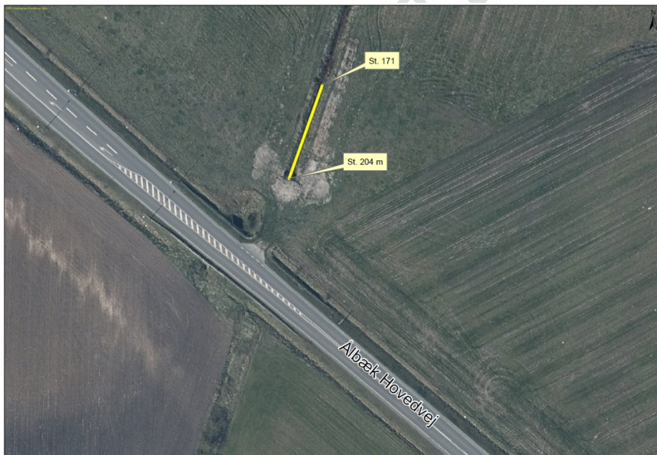
Figur 1: Placering af åbningsstrækning i Opsneum Bæk. Strækningen mellem station 171 m og 204 m er foretaget 2005/2006 (markeret med gul).

I forbindelse med et sammenfald af en rørlagt strækning nord for Ålbæk Hovedvej ved matrikel nr. 3g Solbjerg, Esbjerg Jorder og 9c Opsneum By, Sneum, blev der ved gennemsyn af tidligere luftfotos konstateret en åbning af den rørlagte strækning mellem station 171 m og 204 m foretaget i sommeren 2005/2006 (Figur 1). Af regulativet fremgår det, at Opsneum Bæk skal være rørlagt til station 171 m. Sagsbehandlingen omfatter en lovliggørelse af dette.